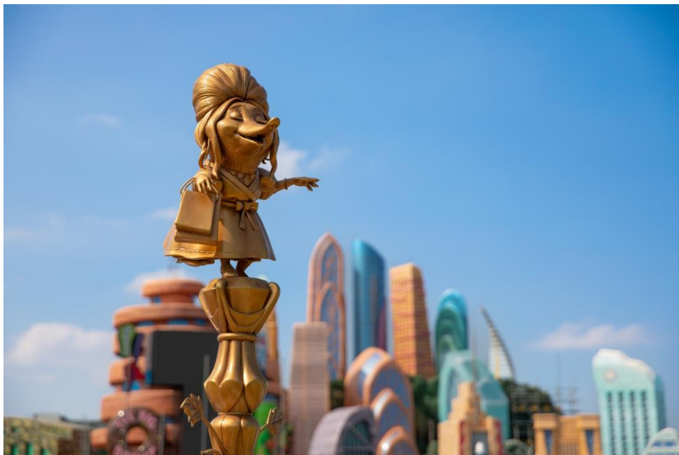
疯狂动物城内的商店——露露精品店的金色塔尖

“疯狂动物城”主题园区融入了一系列故事和场景，通过打造与《疯狂动物城》电影情节一样扣人心弦、生动有趣的体验，让游客充分沉浸在喜爱的电影场景中。开幕后，游客可以前往 大象甜品店 体验丰富的“疯狂动物城化”的主题餐饮。这家甜品店从设计概念到菜单，处处蕴含从电影中汲取的灵感。新园区之行当然少不了来一个巨型棒冰造型的巧克力棉花糖，而以狐狸爪子为造型的迪士尼疯狂动物城棒棒冰同样不容错过，特别设计的山楂口味酸酸甜甜清新爽口，满满都是童年回忆！在这里，游客还能找到豹警官的最爱——大甜甜圈，它必将成为新园区的又一必吃美食！还有其它独具匠心的“疯狂动物城”主题饮品、甜品、小食等趣味十足、美味诱人的餐饮体验尽在 大象甜品店 ，期待游客前来品尝！