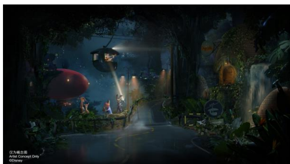
“疯狂动物城：热力追踪”中的主要场景之一——雨林跑道的概念图