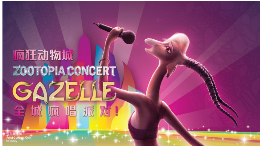
疯狂动物城全城疯唱派对！海报

上海迪士尼度假区总裁及总经理薛逸骏（Joe Schott）表示：“备受喜爱的迪士尼动画电影《疯狂动物城》一经推出就引发了观众的强烈共鸣。我们非常高兴有机会在上海打造独一无二的‘疯狂动物城’主题园区，让游客身临其境地体验这个生动有趣的故事。在历时多年的开发中，来自全球 140 多种专业的专家和人才携手合作，为游客创造能充分沉浸在这个多姿多彩的哺乳动物大都会的特别体验。在各个团队共同努力下所呈现的全新园区让我们倍感自豪，相信游客踏入‘疯狂动物城’园区的那一刻起就会收获满满惊喜。”