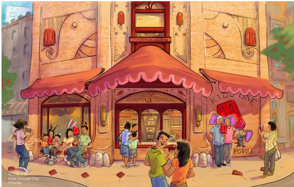
灵感源于电影中一家由大象运营的热门冰淇淋店——大象甜品店的概念图

新园区还将呈现极具创意的现场娱乐体验，生动演绎《疯狂动物城》及其动物居民们。朱迪和尼克正在 警局招募中心 招募新警员，游客将可以在这里与这两位备受喜爱的角色合影留念。在 动物城公园公寓群 ，包括露露和她的爸爸大先生、北极熊考斯洛夫、树懒闪电、牦牛犀利哥、威斯顿公爵以及朱迪的父母兄弟在内的诸多电影中熟悉的角色将在每天不时从不同的窗口探出头来，或相互之间逗趣、或与游客互动。这一由华特迪士尼幻想工程、迪士尼现场娱乐演出、上海迪士尼度假区娱乐演出团队共同打造的特色氛围演出将围绕电影中生动有趣的故事情节，同时基于新园区对细节的精心打磨，以这一独特的方式为游客精彩呈现备受喜爱的角色。在今天的创意发布活动中，露露已经迫不及待地惊喜现身，欢迎游客来到“疯狂动物城”，勇敢“尝试一切”。