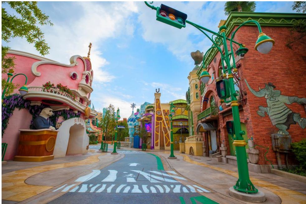
栩栩如生的疯狂动物城将让游客沉浸在这一多姿多彩、活力十足的哺乳动物大都会

“疯狂动物城”不仅有为不同的动物居民度身定制的各类特色商业标志和广告牌，新奇创意和前沿技术的结合更是为这座城市注入了多元活力。例如，在 动物城站 ，透过上方的装饰性彩色玻璃窗，可以看到一列大型列车驶过。就像电影中的片段一样，列车不断来来往往，接送出行的动物居民们。在 舞虎俱乐部 ，夏奇羊著名的伴舞老虎们和其他动物们正在楼上狂欢舞蹈，透过玻璃窗也能看到他们的动感舞姿。在先进的多媒体技术的加持下，这些充满活力的巧思让整座“疯狂动物城”活灵活现地展现丰富多样的动物居民。