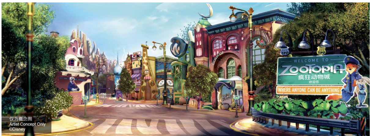
疯狂动物城概念图

上海，2023年9月5日——上海迪士尼度假区今天揭晓了全球首个“疯狂动物城”主题园区、即上海迪士尼乐园第八大主题园区精彩震撼的创意亮点，标志着新园区正式开幕迎客前的又一重要里程碑。融合了迪士尼经久不衰的创意创想与尖端前沿的科技，这个栩栩如生的新园区将让游客充分沉浸在这一多姿多彩、活力十足的哺乳动物大都会，感受在“疯狂动物城”里“每个动物都有无限可能”。这一备受期待的主题园区计划于今年年底开放。