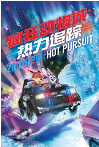
疯狂动物城主要景点“疯狂动物城：热力追踪”海报

外，度假区还在此次创意发布活动中首次揭晓了新园区的主要景点名称—— 疯狂动物城：热力追踪 ，并介绍了其中的精彩故事情节。