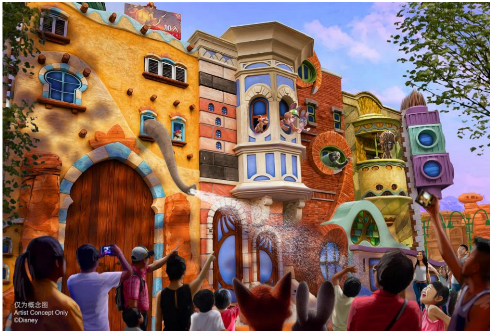
疯狂动物城内的特色氛围演出概念图