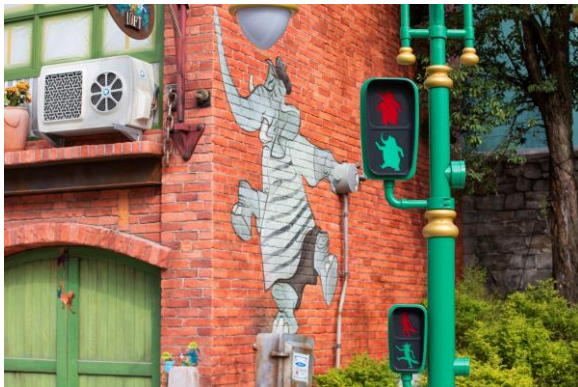
每一处都为不同大小的动物精心设计，包括交通信号灯

和爪印；景观设计的灵感对应动物城里四大地区独特的地理特征，例如在撒哈拉广场可以看到多肉植物和棕榈树。在“疯狂动物城”，城市的设施和设备大小不一，方便体型各异的动物们使用，比如在新园区里会看到的不同高度的直饮水点和不同尺寸的长椅。