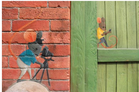
一步一景，呈现动物居民丰富多样的生活