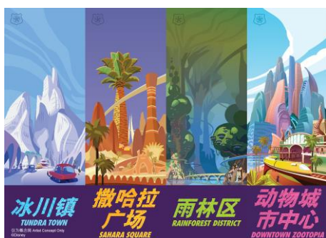
疯狂动物城内各具特色的城区

地形警车将滑过冰川镇的冰面、在撒哈拉广场的街道上搜寻逃犯、一路追踪到神秘泉绿洲和那里的动物们来一次“亲密”接触、从雨林区的高空坠落……沿途，游客将会遇到他们钟爱的“疯狂动物城”中的各个朋友们。本着“疯狂动物城”的精神，带领新警员们勇往直前的朱迪和尼克会在一路上鼓励大家不断尝试，追求梦想，永不言弃。