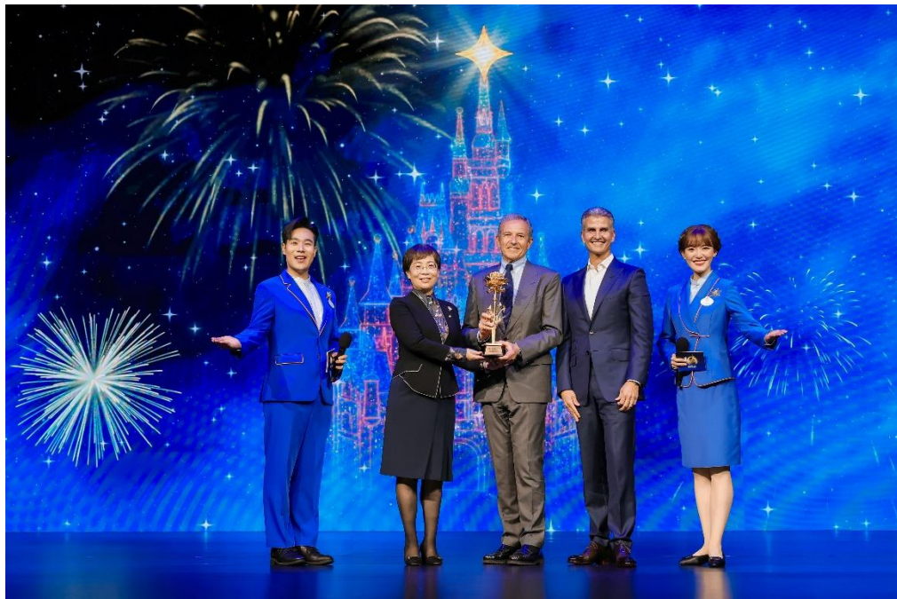
一件等比例复刻了上海迪士尼乐园奇幻童话城堡塔尖的纪念品被赠予 华特迪士尼公司前董事长兼首席执行官罗伯特·艾格（Bob Iger）， 感谢其为打造“原汁原味迪士尼，别具一格中国风”度假区所倾注的心血

多年来，凭借独具特色的迪士尼故事讲述和沉浸式体验，上海迪士尼度假区深受各年龄层海内外游客的喜爱。游客追求快乐和独具特色体验的强烈需求使得上海迪士尼乐园成为全球备受欢迎的主题乐园。2025年10月，上海迪士尼乐园迎来了开幕以来的第一亿位游客，在运营仅九年多的时间里便实现了这一重要里程碑。