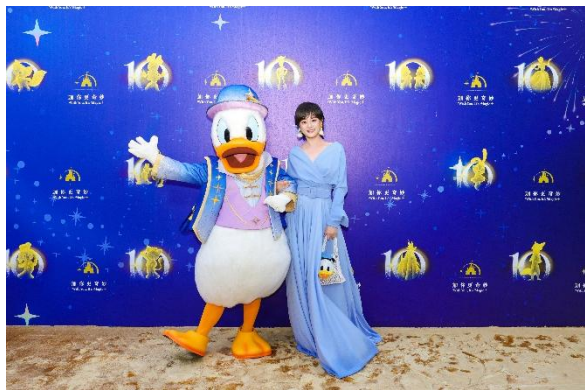
上海迪士尼度假区盛大开幕荣誉大使、知名演员孙俪和唐老鸭