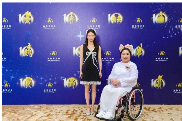
跳水世界冠军陈芋汐和知名铁饼冠军王婷