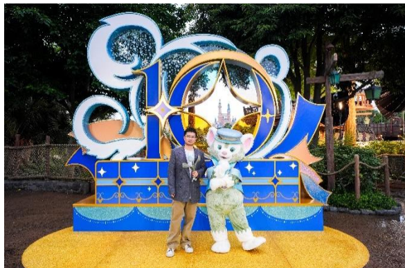
知名作家马伯庸和杰拉多尼