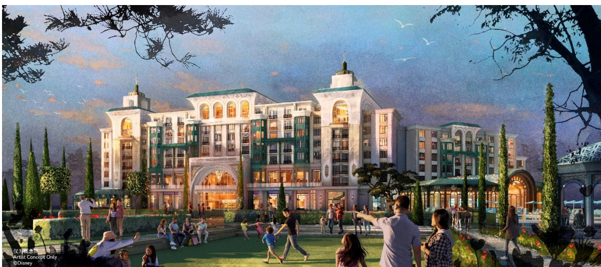
上海迪士尼星愿酒店概念图

这座高端典雅的酒店拥有 400 间客房，建成后将为游客提供一览上海迪士尼乐园与星愿公园的开阔视野。整座酒店融合了迪士尼匠心设计与经典故事讲述，处处皆是别致体验。今年冬季，游客便可在上海迪士尼星愿酒店开启沉浸式住宿体验，感受并发现一个由梦想、心愿及众多迪士尼故事与角色构筑的神奇世界。酒店还将提供全新主题的室内外泳池，以及一系列休闲娱乐设施，为游客打造全年趣味惬意的住宿体验。