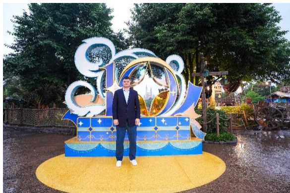
上海迪士尼度假区盛大开幕荣誉大使、国际知名篮球运动员姚明