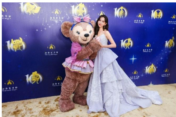
上海迪士尼度假区明星志愿者大使、演员林志玲和雪莉玫