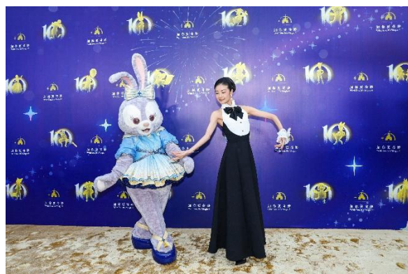
国际芭蕾舞艺术家谭元元和星黛露