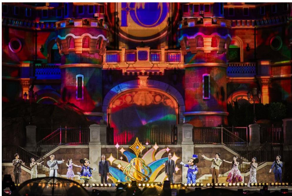
华特迪士尼公司前董事长兼首席执行官罗伯特·艾格(Bob Iger)与现任首席执行官戴明哲 (Josh D'Amaro)、与表演嘉宾及米奇、米妮齐聚奇幻童话城堡舞台，同所有游客共同见证象征上海迪士尼度假区十周年的许愿星闪耀点亮，欢庆“加你更奇妙”的神奇时刻

上海，2026年6月16日——十年前，2016年6月16日，上海迪士尼度假区盛大开幕，为全国和世界各地的游客打开了通往想象力、灵感和神奇的大门。自此，度假区以标志性的迪士尼故事讲述和精心打造的特别体验，为上亿游客创造了无数欢乐瞬间，并成为一座以“原汁原味迪士尼，别具一格中国风”而闻名遐迩的文旅地标。在度假区十周年里程碑的前夜，度假区股东、管理层、以及包括度假区合作伙伴、游客及演职人员在内的与度假区共谱十年辉煌的各方代表一起，共同庆祝这段充满创造力与快乐的十年奇妙之旅。整场庆典盛大恢弘，特邀嘉宾逐一亮相红毯，奇幻童话城堡舞台上演庆典晚会，一场绚丽夺目的夜光幻影秀将庆典活动推向高潮，致敬度假区首个璀璨十年，更展望未来更多奇妙篇章。